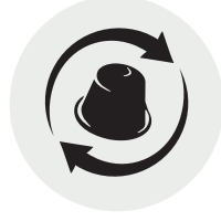
Kaffeekapseln (Aus Alu)